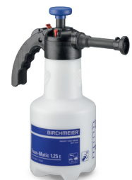
Foam-Matic 1.25 E (Blau = Alkalische Schaummittel) Art.Nr. 11976601