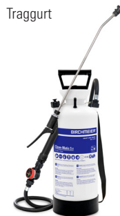
Clean-Matic 5 E (Blau = Alkalische Sprühmittel) Art.Nr. 11907401